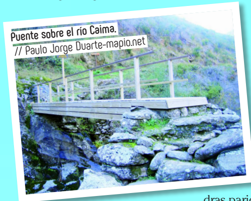
Puente sobre el río Caima.

Para explorar esta zona existe la Rota da Água e da Pedra, dividi-