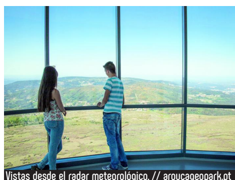
Vistas desde el radar meteorológico.

Arouca creció a la sombra de su monasterio, clasificado como monumento nacional, lugar de retiro de la reina doña Mafalda, hija de Sancho I, que aquí se recogió en 1220. El museo de Arte Sacro que alberga en su interior está considerado uno de los mejores de Europa.